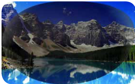
Sonnenbrille ohne polarisierende Gläser

Wir laden Sie ein und nehmen uns die Zeit, um gemeinsam mit Ihnen für Ihre individuellen Anforderungen die optimalen Brillengläser mit Hilfe neuester Technik zusammenzustellen.