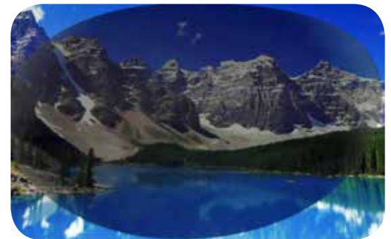
Sonnenbrille mit polarisierenden Gläsern